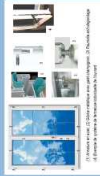
(1) Fenêtre en bois (2) Glasser renforcée avec petit décalage (3) Fenêtre en aluminium (4) Fenêtre de type à vitrage isolé double (5) Fenêtre de type à vitrage isolé simple (6) Fenêtre de type à vitrage isolé simple (7) Fenêtre de type à vitrage isolé simple (8) Fenêtre de type à vitrage isolé simple (9) Fenêtre de type à vitrage isolé simple (10) Fenêtre de type à vitrage isolé simple (11) Fenêtre de type à vitrage isolé simple (12) Fenêtre de type à vitrage isolé simple (13) Fenêtre de type à vitrage isolé simple (14) Fenêtre de type à vitrage isolé simple (15) Fenêtre de type à vitrage isolé simple (16) Fenêtre de type à vitrage isolé simple (17) Fenêtre de type à vitrage isolé simple (18) Fenêtre de type à vitrage isolé simple (19) Fenêtre de type à vitrage isolé simple (20) Fenêtre de type à vitrage isolé simple (21) Fenêtre de type à vitrage isolé simple (22) Fenêtre de type à vitrage isolé simple (23) Fenêtre de type à vitrage isolé simple (24) Fenêtre de type à vitrage isolé simple (25) Fenêtre de type à vitrage isolé simple (26) Fenêtre de type à vitrage isolé simple (27) Fenêtre de type à vitrage isolé simple (28) Fenêtre de type à vitrage isolé simple (29) Fenêtre de type à vitrage isolé simple (30) Fenêtre de type à vitrage isolé simple (31) Fenêtre de type à vitrage isolé simple (32) Fenêtre de type à vitrage isolé simple (33) Fenêtre de type à vitrage isolé simple (34) Fenêtre de type à vitrage isolé simple (35) Fenêtre de type à vitrage isolé simple (36) Fenêtre de type à vitrage isolé simple (37) Fenêtre de type à vitrage isolé simple (38) Fenêtre de type à vitrage isolé simple (39) Fenêtre de type à vitrage isolé simple (40) Fenêtre de type à vitrage isolé simple (41) Fenêtre de type à vitrage isolé simple (42) Fenêtre de type à vitrage isolé simple (43) Fenêtre de type à vitrage isolé simple (44) Fenêtre de type à vitrage isolé simple (45) Fenêtre de type à vitrage isolé simple (46) Fenêtre de type à vitrage isolé simple (47) Fenêtre de type à vitrage isolé simple (48) Fenêtre de type à vitrage isolé simple (49) Fenêtre de type à vitrage isolé simple (50) Fenêtre de type à vitrage isolé simple (51) Fenêtre de type à vitrage isolé simple (52) Fenêtre de type à vitrage isolé simple (53) Fenêtre de type à vitrage isolé simple (54) Fenêtre de type à vitrage isolé simple (55) Fenêtre de type à vitrage isolé simple (56) Fenêtre de type à vitrage isolé simple (57) Fenêtre de type à vitrage isolé simple (58) Fenêtre de type à vitrage isolé simple (59) Fenêtre de type à vitrage isolé simple (60) Fenêtre de type à vitrage isolé simple (61) Fenêtre de type à vitrage isolé simple (62) Fenêtre de type à vitrage isolé simple (63) Fenêtre de type à vitrage isolé simple (64) Fenêtre de type à vitrage isolé simple (65) Fenêtre de type à vitrage isolé simple (66) Fenêtre de type à vitrage isolé simple (67) Fenêtre de type à vitrage isolé simple (68) Fenêtre de type à vitrage isolé simple (69) Fenêtre de type à vitrage isolé simple (70) Fenêtre de type à vitrage isolé simple (71) Fenêtre de type à vitrage isolé simple (72) Fenêtre de type à vitrage isolé simple (73) Fenêtre de type à vitrage isolé simple (74) Fenêtre de type à vitrage isolé simple (75) Fenêtre de type à vitrage isolé simple (76) Fenêtre de type à vitrage isolé simple (77) Fenêtre de type à vitrage isolé simple (78) Fenêtre de type à vitrage isolé simple (79) Fenêtre de type à vitrage isolé simple (80) Fenêtre de type à vitrage isolé simple (81) Fenêtre de type à vitrage isolé simple (82) Fenêtre de type à vitrage isolé simple (83) Fenêtre de type à vitrage isolé simple (84) Fenêtre de type à vitrage isolé simple (85) Fenêtre de type à vitrage isolé simple (86) Fenêtre de type à vitrage isolé simple (87) Fenêtre de type à vitrage isolé simple (88) Fenêtre de type à vitrage isolé simple (89) Fenêtre de type à vitrage isolé simple (90) Fenêtre de type à vitrage isolé simple (91) Fenêtre de type à vitrage isolé simple (92) Fenêtre de type à vitrage isolé simple (93) Fenêtre de type à vitrage isolé simple (94) Fenêtre de type à vitrage isolé simple (95) Fenêtre de type à vitrage isolé simple (96) Fenêtre de type à vitrage isolé simple (97) Fenêtre de type à vitrage isolé simple (98) Fenêtre de type à vitrage isolé simple (99) Fenêtre de type à vitrage isolé simple (100) Fenêtre de type à vitrage isolé simple

2 – Vitrage : A la lecture de l'annexe C2 du Cahier Applicatif, nous pouvons constater que le double vitrage 4/16/4 n'est pas suffisant, mais que l'application d'un film de protection anti-fragment posé par fixation chimique ou mécanique lui permet de résister à la surpression, ou de casser sans risques de blessure par bris de vitres pour les personnes.