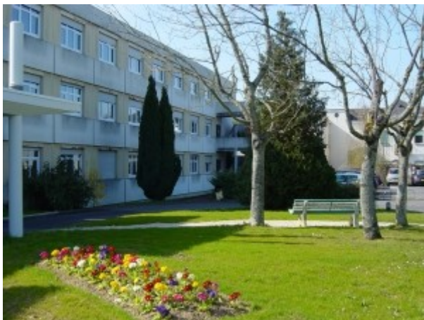
Le centre hospitalier intercommunal Amboise-Château-Renault.