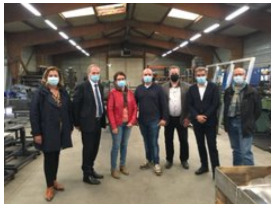
Visite de la Maison Rémy Garnier, bronzier d'art à Château-Renault