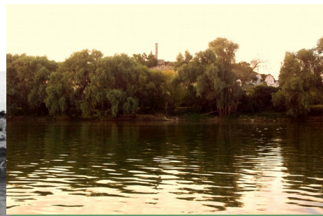
La même vue en 2016 ...