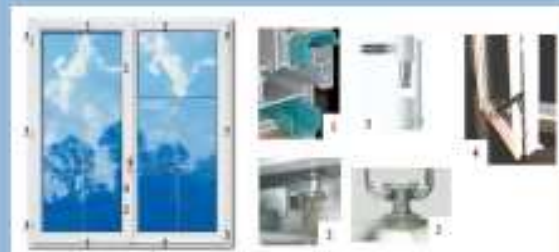
(1) Armature en acier, (2) Gâche métallique avec pied champignon, (3) Pointe anti-déperdage, (4) Exemple de système de fermeture rotatoire de l'ouvrant

2 – Vitrage : A la lecture de l'annexe C2 du Cahier Applicatif, nous pouvons constater que le double vitrage 4/16/4 n'est pas suffisant, mais que l'application d'un film de protection anti-fragment posé par fixation chimique ou mécanique lui permet de résister à la surpression, ou de casser sans risques de blessure par bris de vitres pour les personnes.