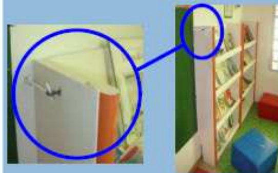
Fixation d'un élément de bibliothèque

Risque de déplacement, basculement, projection : fixer ces éléments aux murs, planchers, cloisons par des systèmes adéquats (vis, boulons, chevilles).