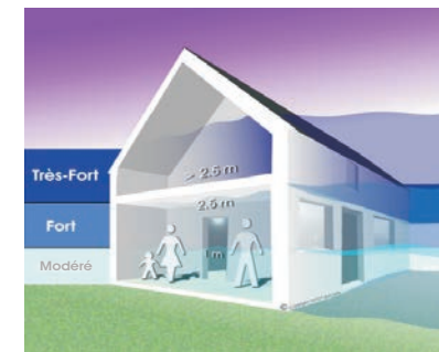
Hauteur de submersion illustration.